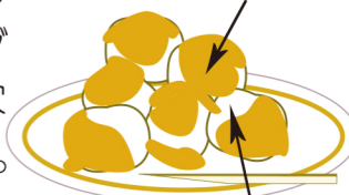
秋田県産うるち米製お餅